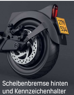
Scheibenbremse hinten und Kennzeichenhalter