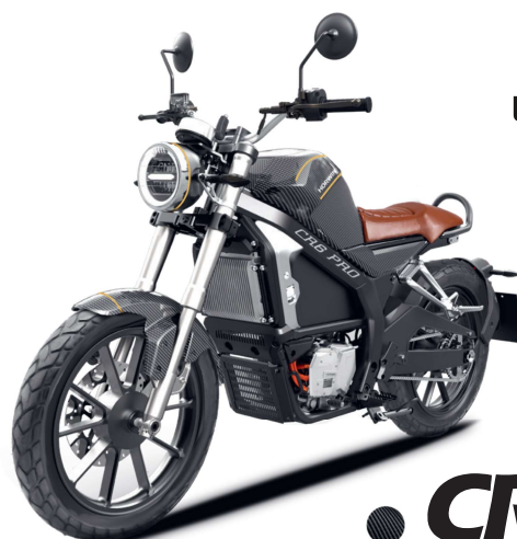
● CR6 Pro

Attraktives Design, neueste E-Technologie